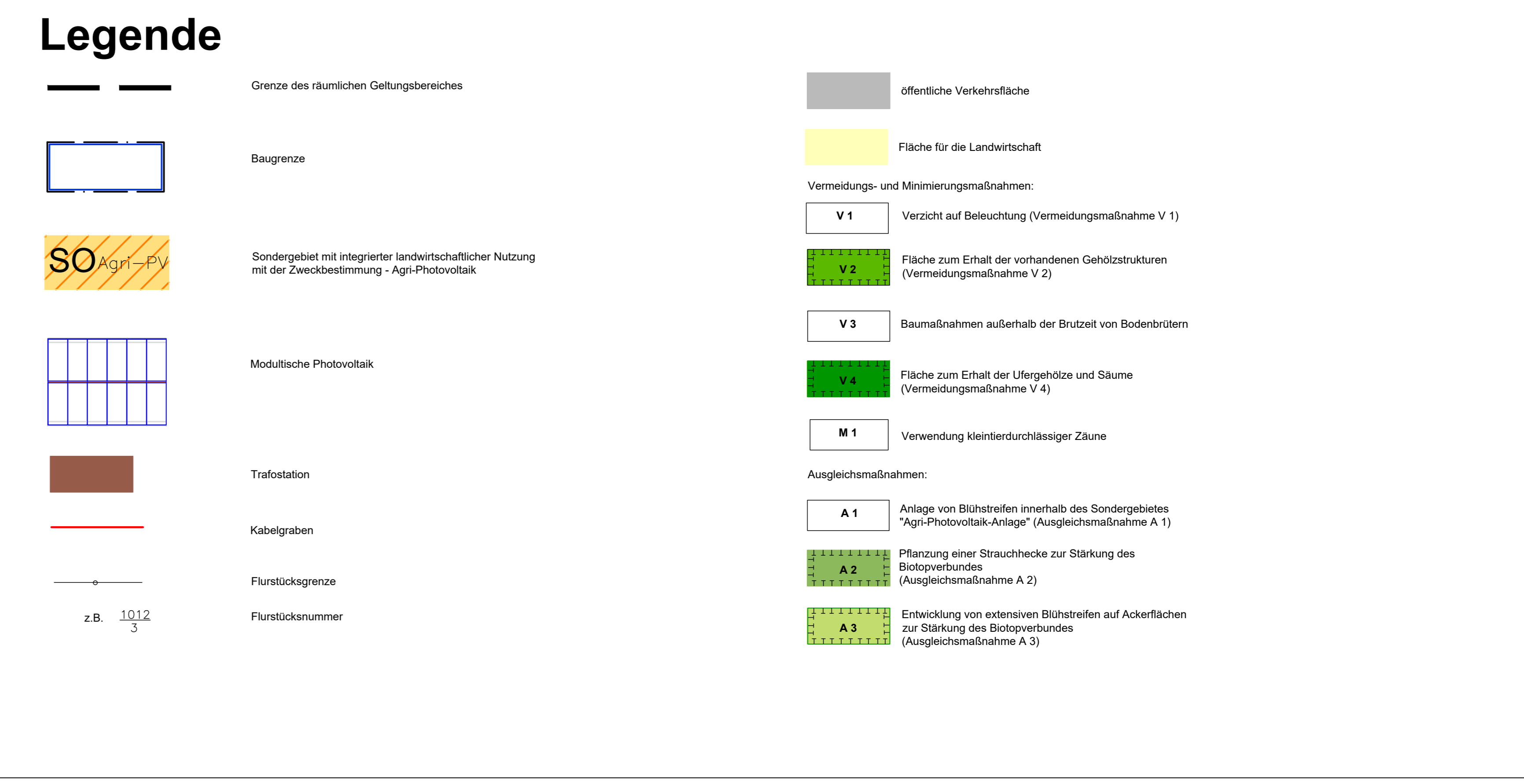
Agri-PV-System nach DIN SPEC Kategorie II, Var. 2.1