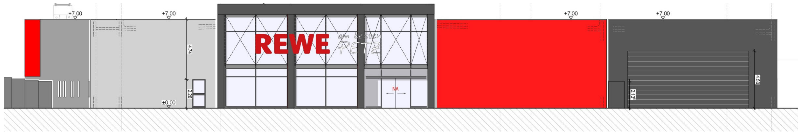
Ansicht 1 (Südost) Darstellung ohne Maßstab